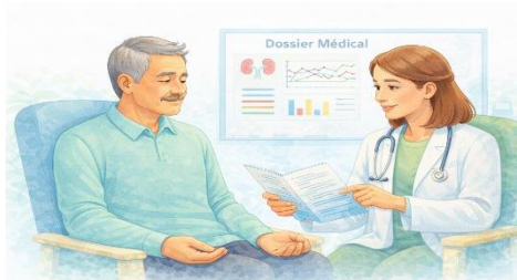
Droit à l'information — médecin et patient