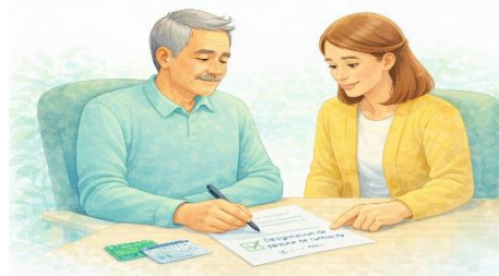
Personne de confiance — désignation écrite